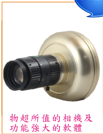
物超所值的相機及功能強大的軟體