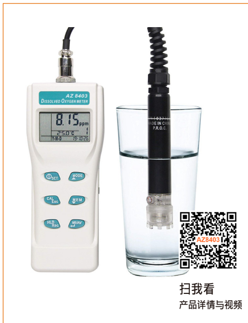
扫我看 产品详情与视频