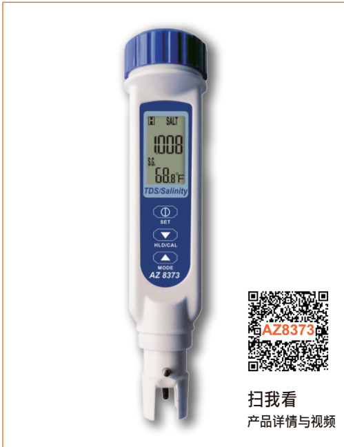
扫我看 产品详情与视频